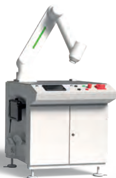
Table robotisée pour cobots : Tables robotisées pour cobots issus du système modulaire X-frame